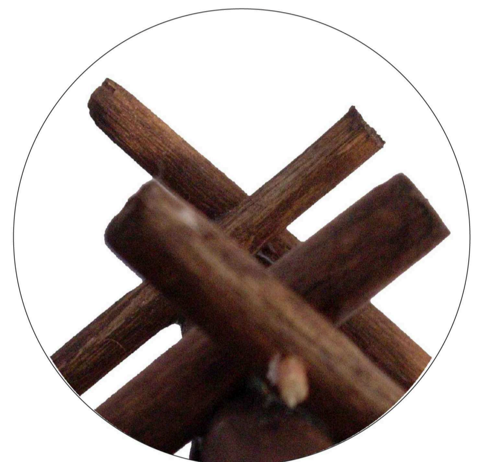
ANCORAGGIO DI DUE FALSI PUNTONI INCERNIERATI E APPOGGIATI ALLA TRAVE DI COLMO