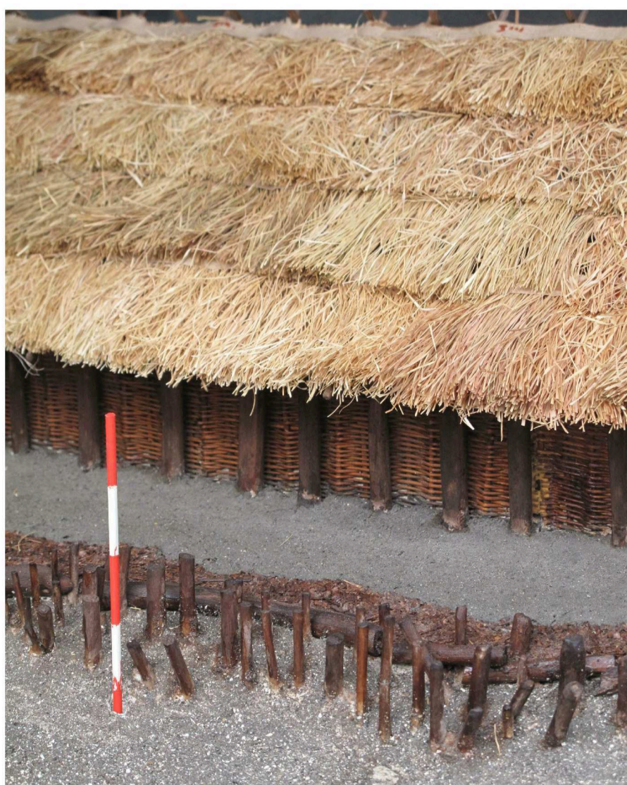
SOSTEGNO DELLA PARETE DI TOMPAGNO IN RAMOSCELLI INTRECCIATI