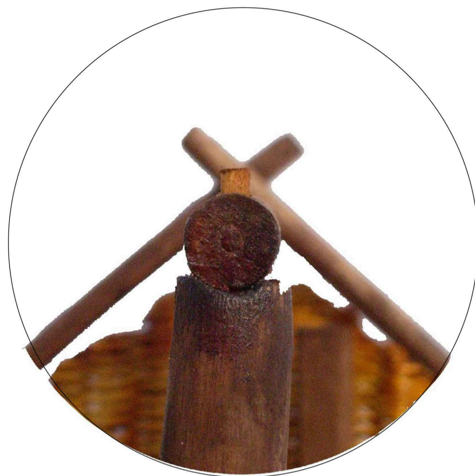
ANCORAGGIO DELLA TRAVE DI COLMO AL PALO VERTICALE